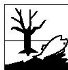
N Dangereux pour l'environnement