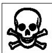
T+ Très toxique